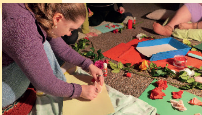
Naša výroba ruží

Hodina ruže je zameraná najmä na rozvoj zmyslov - čuch, chuť, hmat, zrak a sluch. Na tejto hodine sme ochutnávali šípový džem, ovoniavali živé ruže, sledovali obrázky ruží, rozprávali sa o ruži a jej pôvode, počúvali rozprávku o Šípkovej Ruženke a nakoniec sme si vlastné ruže vyrobili z krepového papiera. Každý týždeň si stanovíme konkrétnu tému stretnutia. Ruža, dúha, les, ovocie - témy, ktoré sú niečím zaujímavé a prostredníctvom ktorých sa vieme naučiť nové vedomosti a precvičiť tie schopnosti, ktoré už máme.