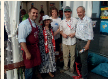
Partners z nemeckej a maďarskej diakonie

Ako každé 2 roky sa Evanjelickej diakonie zúčastnila cirkevných dní v Nemecku, ktoré tentokrát apelovali na mier, vysporiadanie medzinárodných kríz, ako aj na aktuálnu situáciu utečeneckých tokov a možností riešenia tejto problematiky. Atmosféra bola vynikajúca, program bol bohatý na širokú paletu výberu. Počas cirkevných dní sme viedli zaujímavé diskusie a duchovné stretnutia s našimi partnermi a nadviazali ďalšie nové partnerstvá.