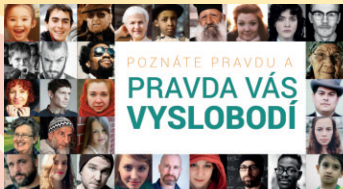
EVS konferencia 2015

V dňoch 1. - 3. mája 2015 sa naplnila veľká sála tentoraz Domu umenia v Piešťanoch množstvom ľudí, ktorí si ako každý rok prišli vypočuť skvelých