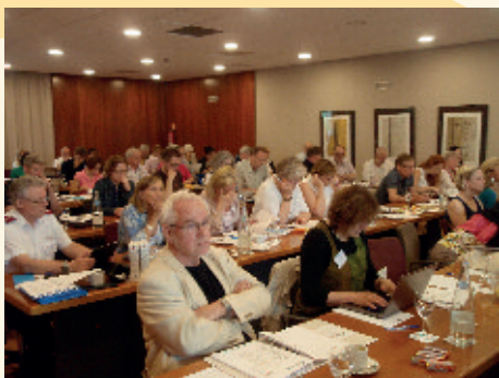
Valné zasadnutie AGM

Práve tieto slová boli heslom pre tohtoročný Annual General Meeting Eurodiaconie, na ktorom sme sa ako členská organizácia zúčastnili v dňoch 10. – 12.