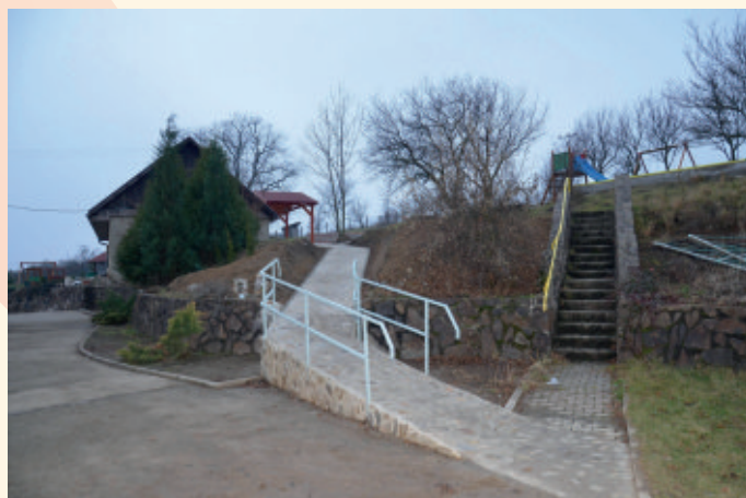
Bezbariérový prístup k častiam areálu

V rámci projektu bolo zrenovované staré pieskovisko, pribudli nové súčasti ihriska – hojdačky, drevený reťazový most a trampolína.