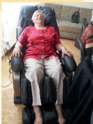
Relax v masážnom kresle

O tom, že čas rýchlo plynie sa presvedčame každým dňom. Termíny, povinnosti, udalosti nám nedovolia ani na chvíľu zastať. S plynúcim časom sa úmernou rýchlosťou míňa aj čas nášho života... Ale sme vďační, že nám neplynie v samote a v nečinnosti. Práve naopak, v našom stredisku „Prameň“ v Slatine nad Bebravou prežívame čas aktívne, s radosťou, s úsmevom.