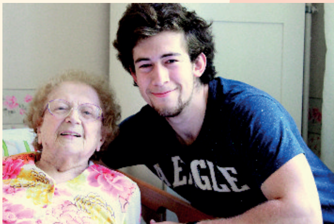
Nemecko - slovenské priateľstvá

Je to príležitosť naučiť sa veľmi veľa vecí. V prvom rade samostatnosti. Je to tiež možnosť spoznať rôzne krajiny, ich kultúru, jazyk a zároveň možnosť využiť svoje dary pre pomoc ľuďom. Vidím v tom príležitosť urobiť niečo dobré pre druhých ľudí, pretože v živote je dôležité nielen prijímať, ale aj niečo ponúknuť. Rok dobrovoľníctva na Slovensku je pre mňa prvou skúsenosťou v tejto oblasti. V Nemecku máme možnosť ísť len raz do zahraničia ako dobrovoľníci a u nás som zatiaľ popri škole nemal dostatok času.