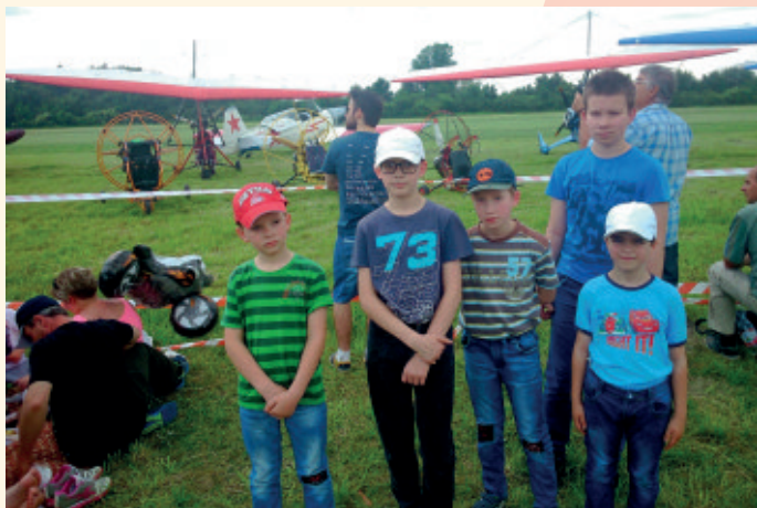
Deti rodiny Makovníkovej

V súčasnosti naše SED Banská Bystrica Domov detí poskytuje starostlivosť 38 deťom. V našom Domove detí im vytvárame čo najlepšie podmienky pre ich zdravý psychický, fyzický a sociálny vývin. Deťom sa poskytuje starostlivosť v rodinnom prostredí – v profesionálnych rodinách (PR), kde im je nahrádzaná láska, spokojnosť, ktorá im bola v živote od svojej biologickej rodiny odopretá.