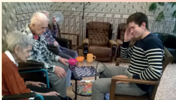
Voľnočasové aktivity v SED BA

Výborné sú bryndzové halušky, klobásy, gazdovský rezeň z Divného Janka, kofola. Nezvyčajné pre mňa bolo, že máte každý deň na obed polievku v rámci hlavného jedla.