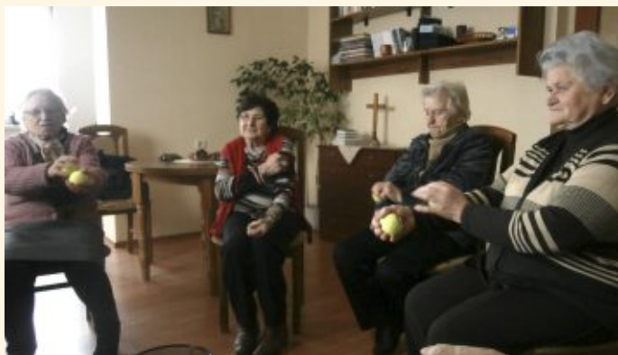
Masáž tenisovou loptičkou

Všetkým sa nám stáva, že zabúdame. S pribúdaním rokov naša pamäť slabne a udržiavať mozog v dobrej kondícii je dôležité najmä počas staroby. Na zvyšovanie kondície pamäte slúžia aj špecializované tréningy.