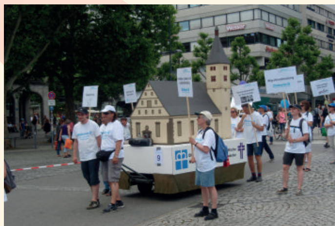
Promenáda nemeckej diakonie

Ako každé 2 roky sa Evanjelickej diakonie zúčastnila cirkevných dní v Nemecku, ktoré tentokrát apelovali na mier, vysporiadanie medzinárodných kríz, ako aj na aktuálnu situáciu utečeneckých tokov a možností riešenia tejto problematiky. Atmosféra bola vynikajúca, program bol bohatý na širokú paletu výberu. Počas cirkevných dní sme viedli zaujímavé diskusie a duchovné stretnutia s našimi partnermi a nadviazali ďalšie nové partnerstvá.